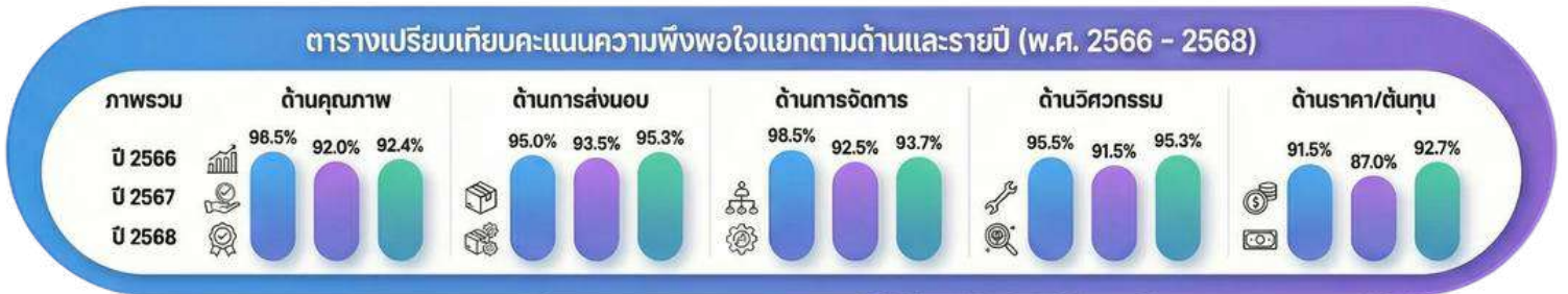
ตารางเปรียบเทียบคะแนนความพึงพอใจแยกตามด้านและรายปี (พ.ศ. 2566 - 2568)

ปี 2568 คะแนนความพึงพอใจโดยรวมอยู่ที่ 92.4% ปรับตัวขึ้นจากปีก่อนที่ 92.0% โดยด้านการส่งมอบและวิศวกรรมปรับขึ้นที่ 95.3% และด้านราคา/ต้นทุนปรับขึ้นมากที่สุดจาก 87.0% เป็น 92.7%